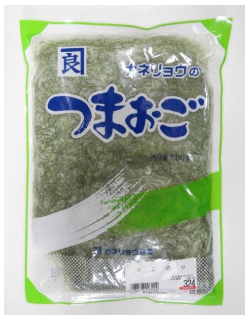
「カネリヨウのつまおご(おごのり)500g(324 円)」