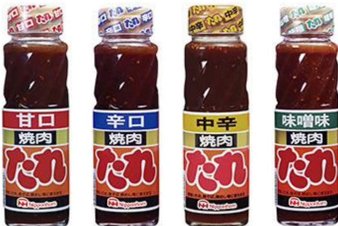
(甘口) (辛口) (中辛) (味噌味)