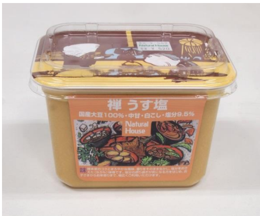
「禅 うす塩味噌 500g (562円)」